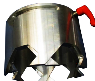
FIX-adapter till ventilratt